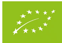
Kuva 4: EU:n luomumerkki

Muita ympäristö- ja energiamerkkejä ovat EU:n ja USA:n yhteinen Energy Star-merkki (kuva 5) sekä kansainvälinen ympäristömerkki sähkölle eli EKOenergia-merkki (kuva 6).