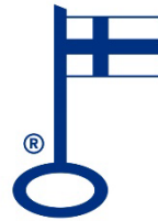
Kuva 10: Avainlippu-merkki